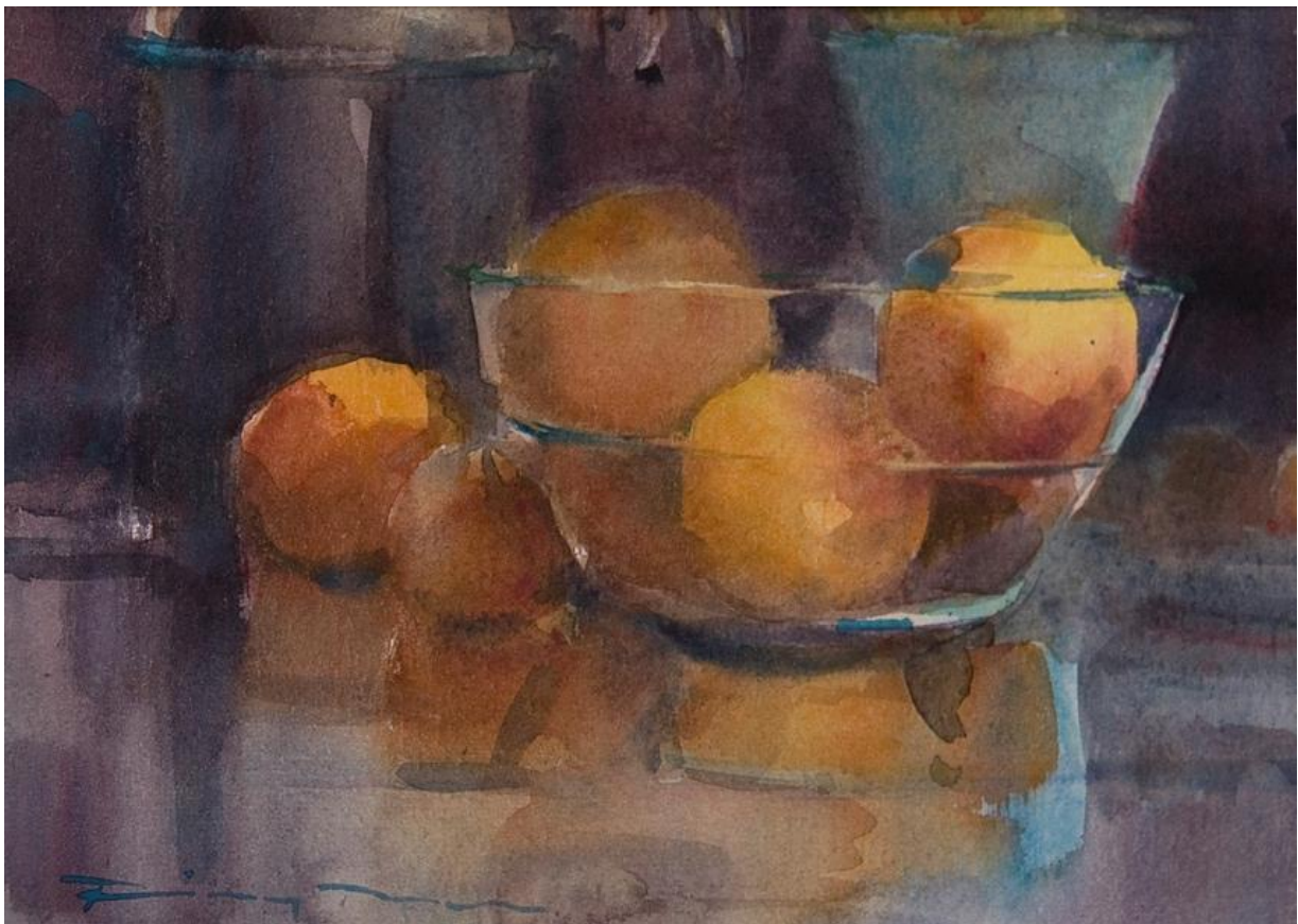
Werk van Riny Bus

Materiaal: houtskool en olieverf (of een andere verfsoort naar keuze)